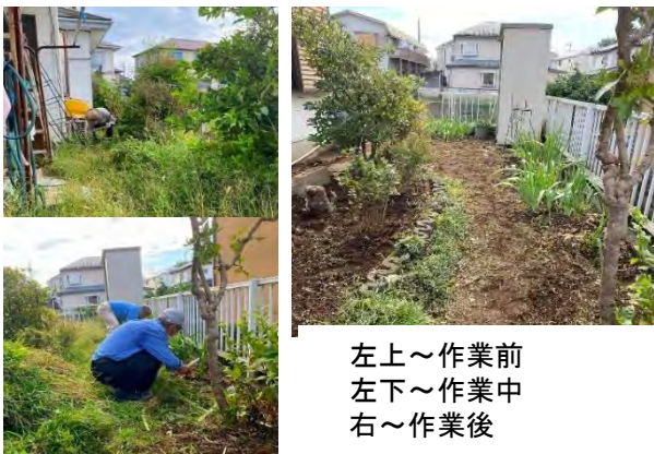
左上～作業前 左下～作業中 右～作業後