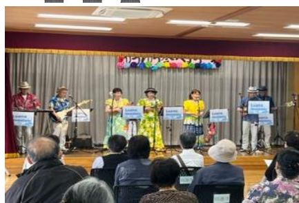
前原会館 ハワイアンソングと歌