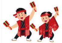
布施近隣センター よきこい踊り