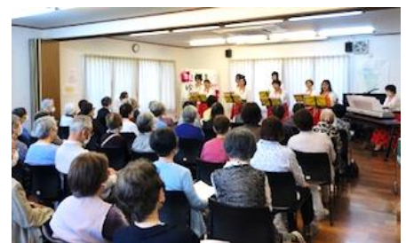
布施新町ふるさとセンター 歌と寸劇