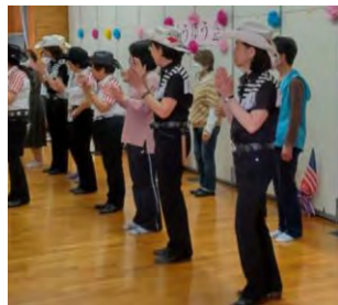
催し物の一部(令和6年)