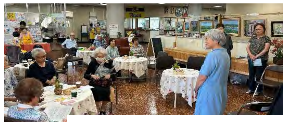
R06.10月 朗読(福祉朗読ハルの会)