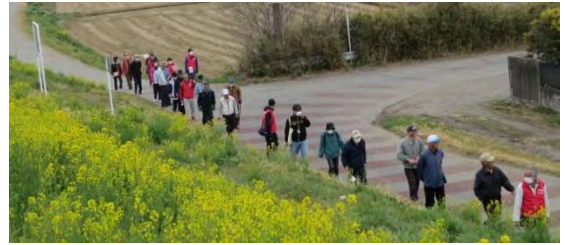
富勢ウォーク実行委員会