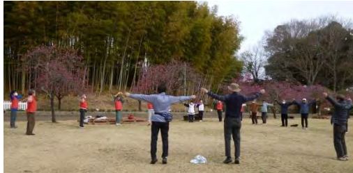
出発前の準備運動