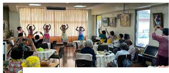
R06. 8月介護予防フラダンス(アロハ)