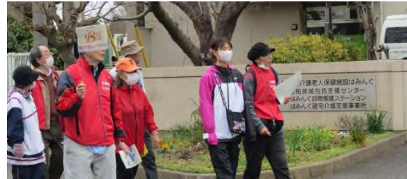
介護老人保健施設はみんく